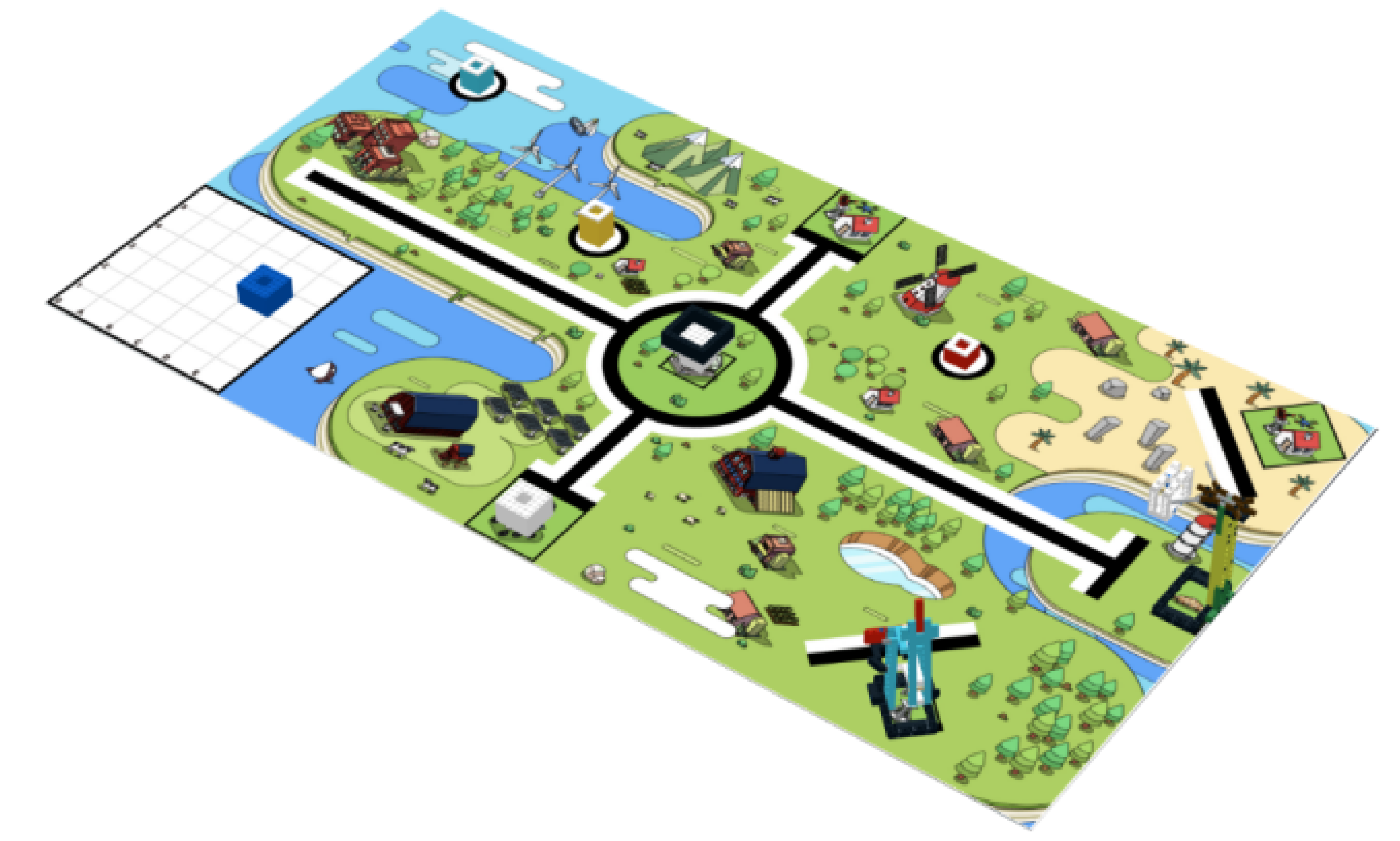
图3 比赛场地 45 度俯视示意图（带模型）