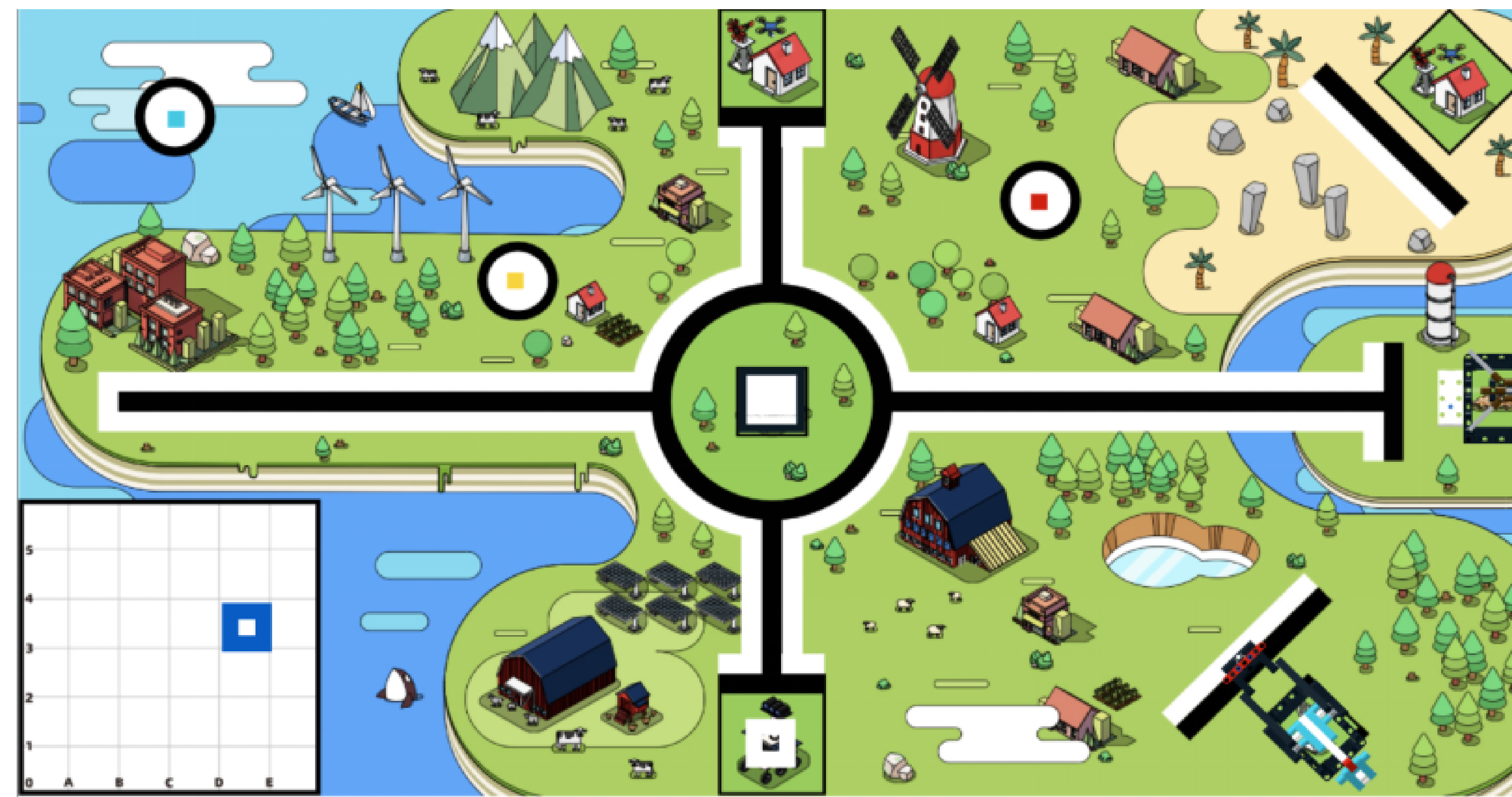
比赛场地示意图（带模型）